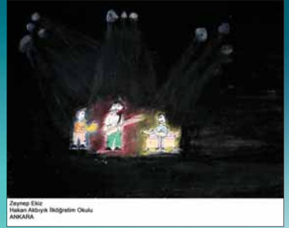
Pınar Kido Resim Yarışması