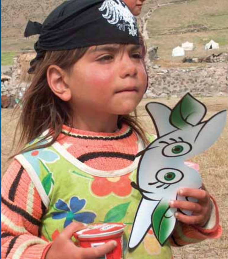
Pınar Kido Çocuk Tiyatrosu