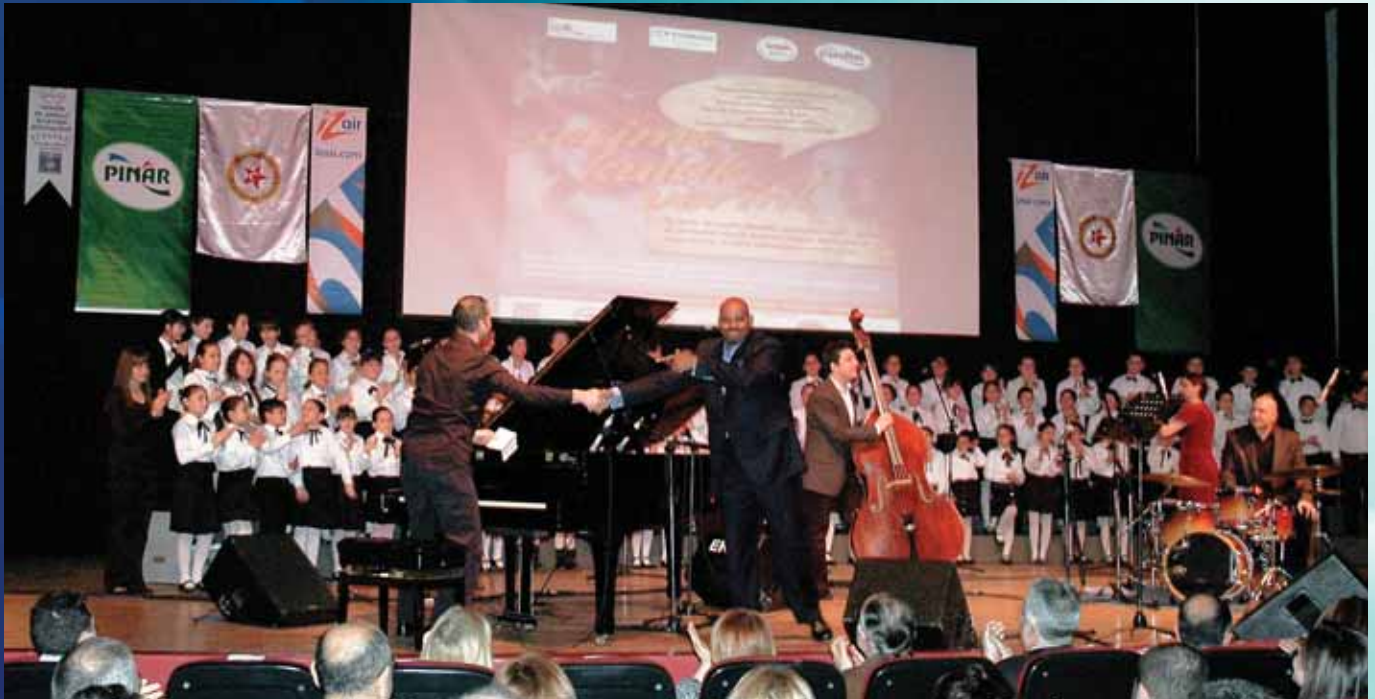
TOBAV-Pınar "Sesime Kulak Verin"